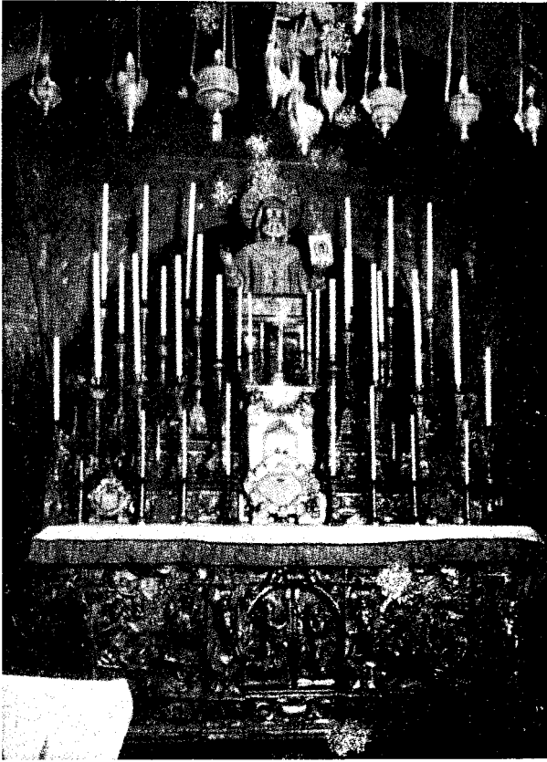
Престол нижней церкви (крипты) св. Николая Чудотворца в Бари, под которым почивают св. мироточивые мощи Угодника.